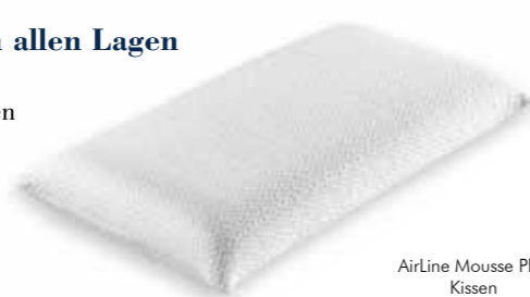
AirLine Mousse Plus Kissen

Als optimale Ergänzung empfehlen wir aus unserem Sortiment das AirLine Mousse Plus Kissen oder das Ergo Kissen sowie die MelaFit Unterfederung (siehe Rückseite).