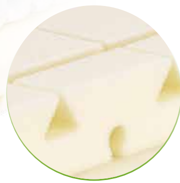
Multizonenschnitt für höchste Anpassungsfähigkeit und seitliche AirPipes für optimale Durchlüftung