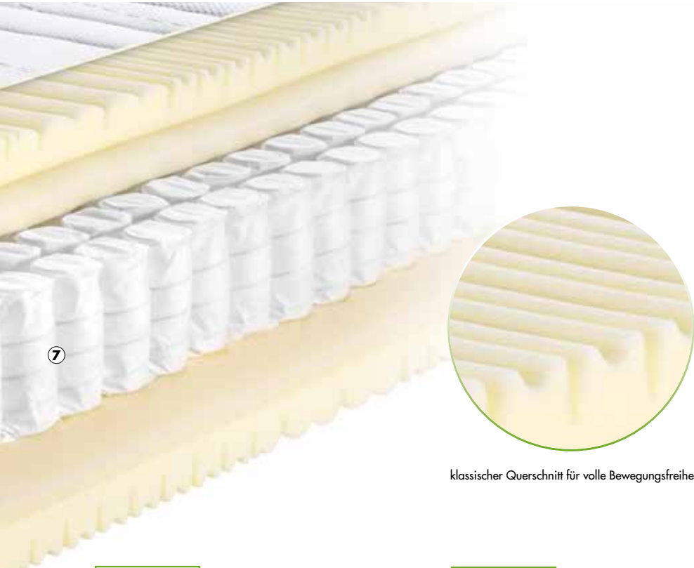
klassischer Querschnitt für volle Bewegungsfreiheit