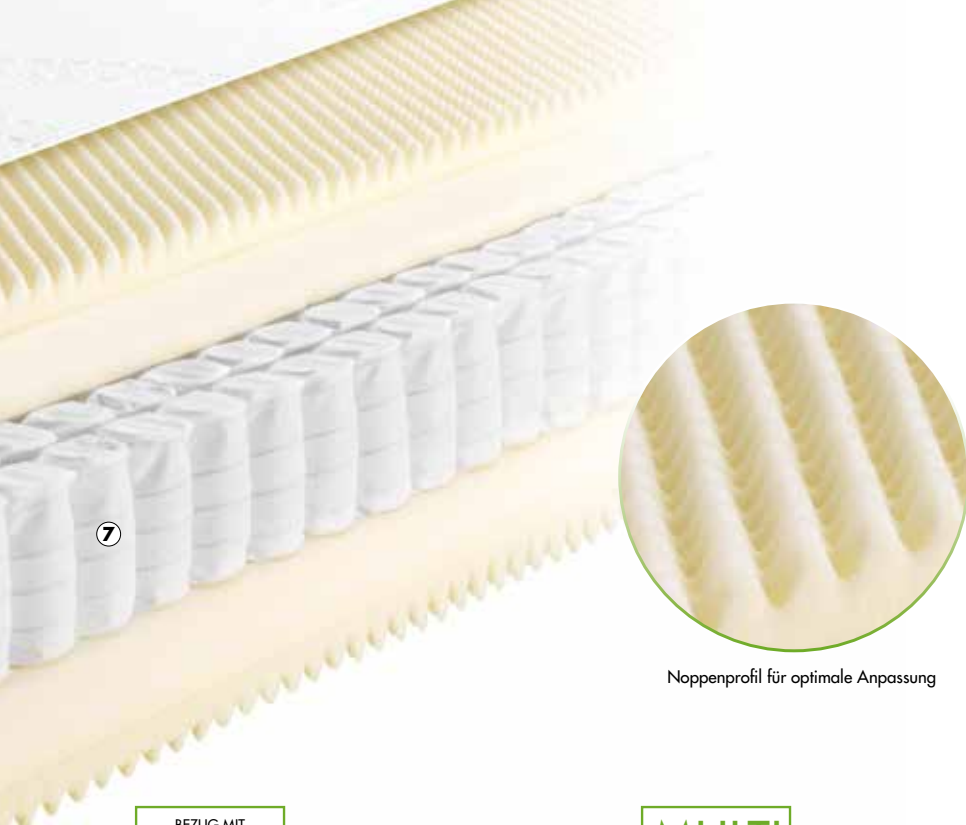
Noppenprofil für optimale Anpassung